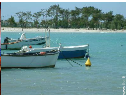
barca a motore